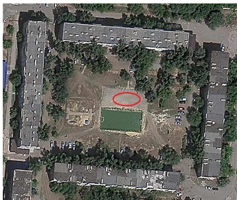
ул.Абая 5 (Молочный двор)