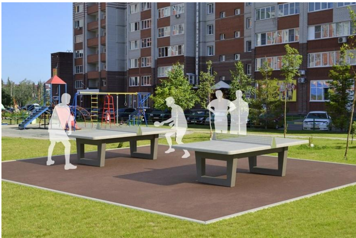
Настольный теннис во дворе