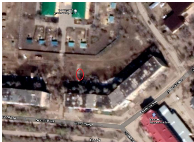
ул. Есет-батыра 1 (Олимпийский двор)