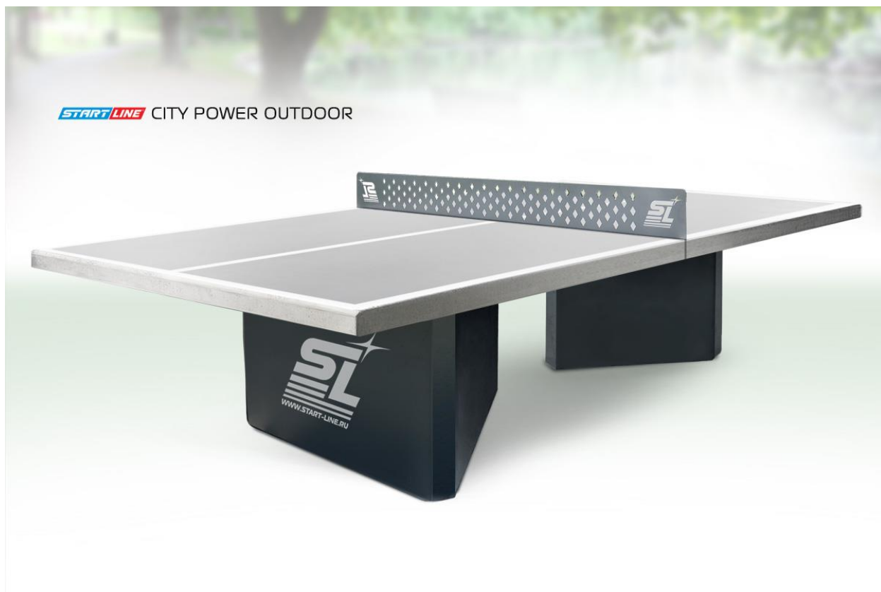
Теннисный стол City Power Outdoor - бетонный антивандальный теннисный стол для открытых площадок.

В 2021 году мы хотим установить антивандальные столы для настольного тенниса для развития этого вида спорта среди детей, подростков и взрослых и для профилактики здоровья.