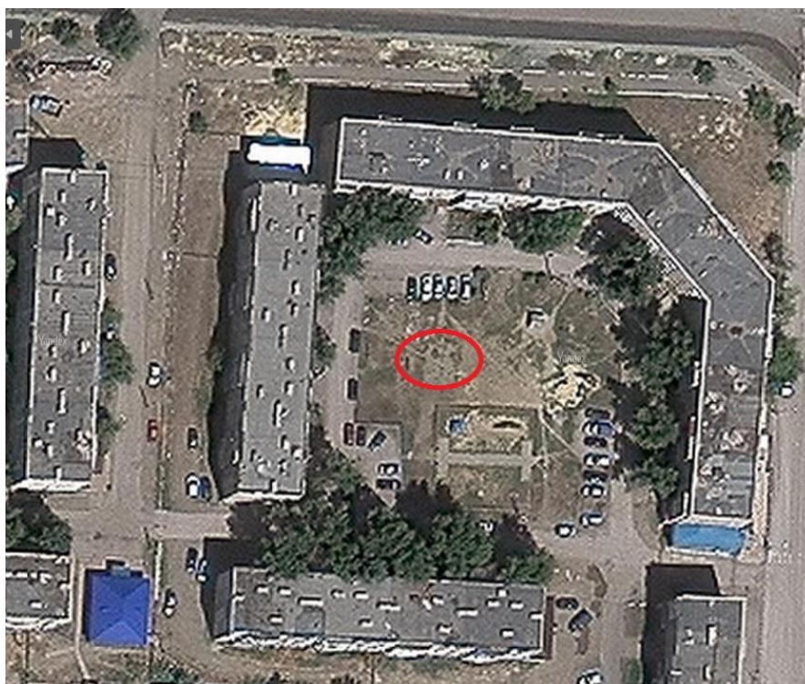
ул. Бр. Жубановых 6 (Книжный двор)