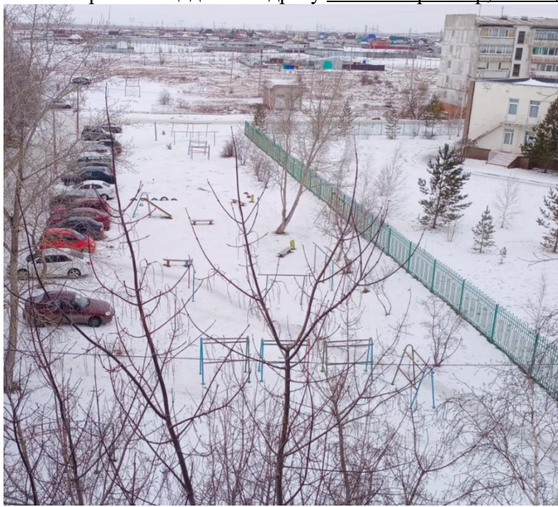
Фото старой площадки по адресу пос. Качар 3 мкр, 21-22 дом