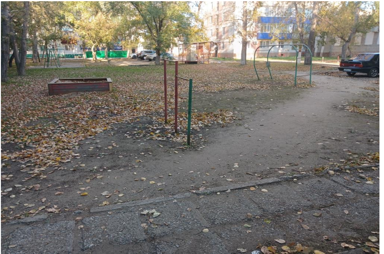
2. Фото старой площадки 1 мкр., 26 дом.